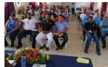
ENCUENTRO DE DIRIGENTES TRANSPORTE ESCOLAR