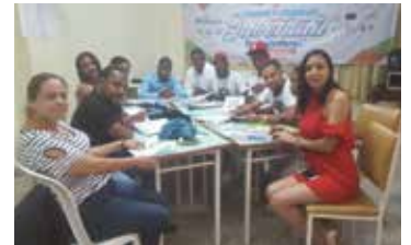
TALLER DE LIDERES JUVENTUD TRABAJADORA