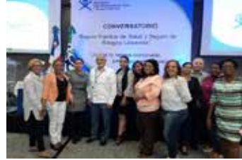
CONVERSATORIO EN SISALRIL SOBRE ATENCIÓN PRIMARIA 8 DE MARZO 2018