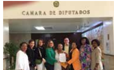
VISITA AL CONGRESO PARA LA LEY ESPECIAL DE TRABAJO DOMESTICO