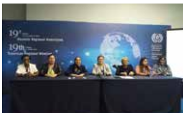
REUNIÓN REGIONAL DE LA OIT DE LAS AMERICA EN PANAMA