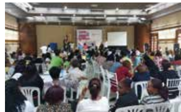
CONVERSATORIO SISALRIL SOBRE ATENCIÓN PRIMARIA