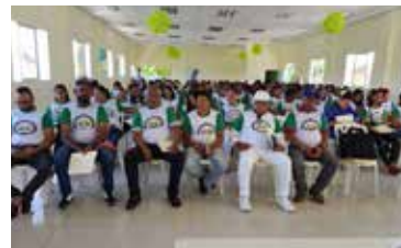
ENCUENTRO FENABANCA NACIONAL EN LA CASC