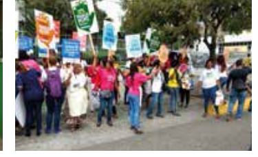
PIQUETE FRENTE A LA SECRETARIA DE TRB. DOMESTICA 8 DE MARZO 2018