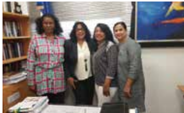
VISITA AL TRIBUNAL CONSTITUCIONAL CONV, 156