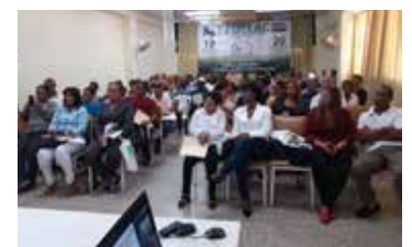
ENCUENTRO DE MUJERES RURALES EMPRENDEDORAS