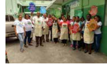
DOMESTICA 8 DE MARZO 2018 SINTRADOMES-CASC