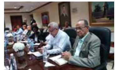
SINDICATOS EN EL CONGRESO DE LA REPUBLICA EN LA COMISION DE SEGURIDAD SOCIAL REVISANDO LA LEY 87-01 4