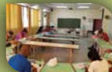
Amplios salones de eventos