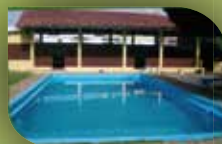
Área de recreación