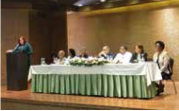
8 DE MARZO FIRMA ACUERDO CON EL MINISTERIO DE LA MUJER