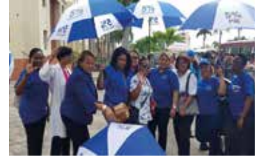
CAMPAÑA 5% DEL PIB PARA LA SALUD