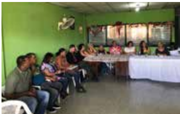
DELEGACION BELGA-AFRICA OFICINA DE SANTIAGO- CASC