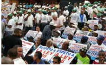
ACCION DEL DIA DEL TRABAJO 1 DE MAYO 2018