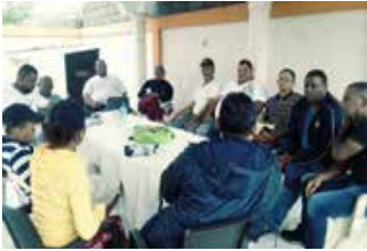
CHARLA DE AMUSSOL DE TRANSPORTE ESCOLAR BANI