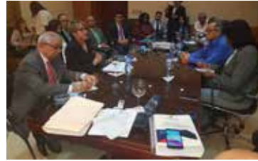
COMISION SEGURIDAD SOCIAL DEL CONGRESO Y CENTRALES SINDICALES