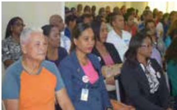
ENCUENTRO DE MUJERES CONTRA LA VIOLENCIA EN AZUA