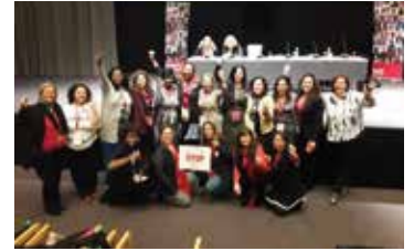
DELEGACION DE MUJERES CSA AL 4TO CONGRESO CSI