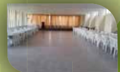
Amplios salones de actos