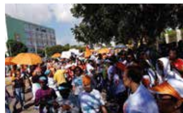
MARCHA CONTRA LA VIOLENCIA DE GENERO 25 DE NOV 2018