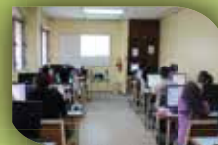
Equipos de apoyo Didacticos