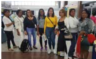
DELEGACION DE UNAMUT-CASC VISITA DE INTERCAMBIO CON LA UGT BRASIL