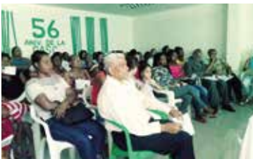
TALLER DE MANEJOS DESECHOS SOLIDOS EN LA CASC