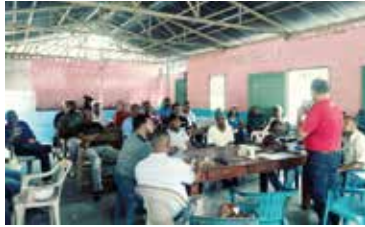
CHARLA DE AMUSSOL TRANSPORTE ESCOLAR DE SAN CRISTOBAL