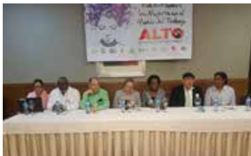
FORO MUJERES 2017 ALTO A LA VIOLENCIA EN EL MUNDO DEL TRABAJO