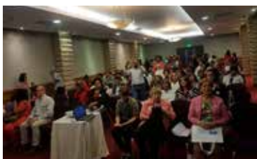
FORO DE MUJERES ALTO A LA VIOLENCIA EN EL MUNDO DEL TRABAJO