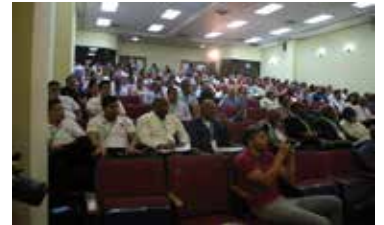
4TO. CONGRESO TURISSOL