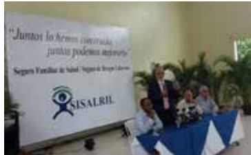
TALLER SFS SISALRIL