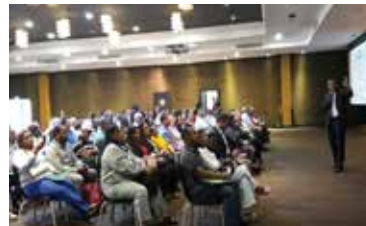
CONGRESO DE ARL 2017