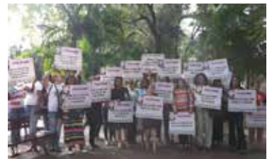
CIMTRA 8 DE MARZO 2017