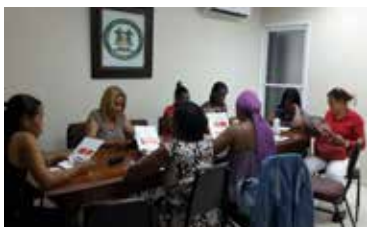
COMITE EJECUTIVO DOMESTICAS