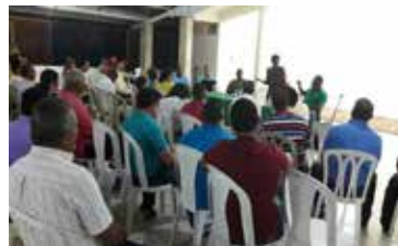
CHARLA TRANSPORTISTAS ESCOLARES