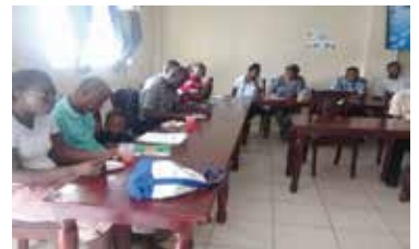
CHARLA A PROMOTORES MOSTHA