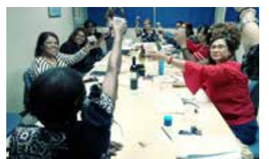
EVALUACION CIMTRA 2017