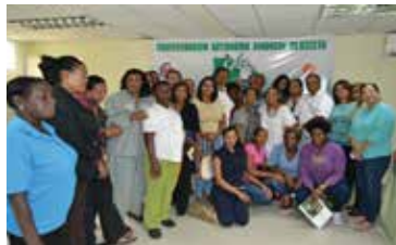
CONFERENCIA HAMBRE CERO EN LA CASC