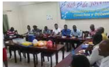
CHARLA A PROMOTORES MOSTHA