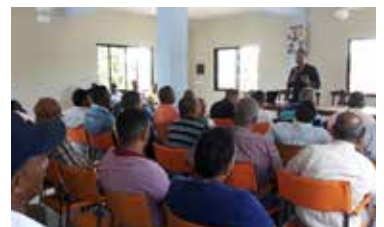
ENCUENTRO CON TRANSPORTISTAS DEL SEIBO