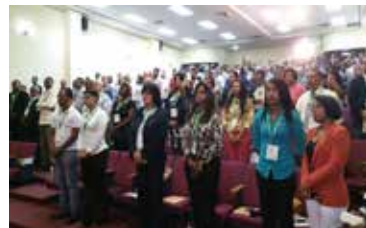
3ER CONGRESO DE TURISSOL