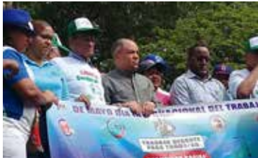
MARCHA UNITARIA 1 DE MAYO 2017