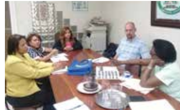
VISITA WSM AMUSSOL