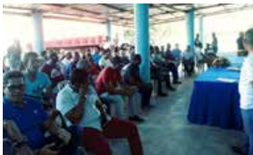
CHARLA CAMIONEROS DE BANI