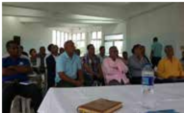
REUNIÓN DE TRANSPORTISTAS EN ATPRA - HIGUEY