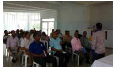
ENCUENTRO DE ORGANIZACIONES EN HIGUEY