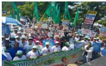
MARCHA DIA DEL TRABAJADOR