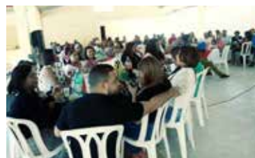
ALMUERZO NAVIDENO AL PERSONAL DE AMUSSOL - INFAS CASC