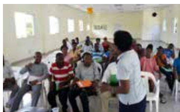
TALLER PROMOTORES MOSTHA -FEI