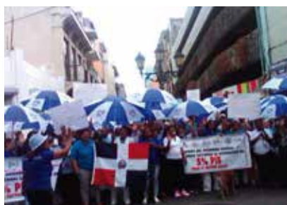
Demandamos el 5% del PIB para el sector salud