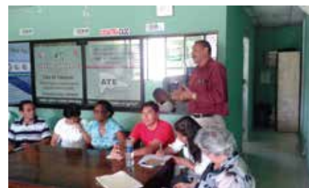
Visita AMUSSOL - CASC, Santiago