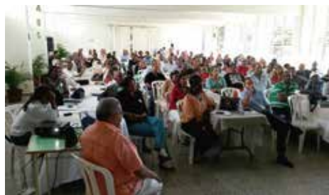
3er. Congreso Riesgo Laborales CASC Creando cultura de prevención de riesgos