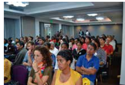
Foro sobre violencia de genero "NO MAS DOLOR"