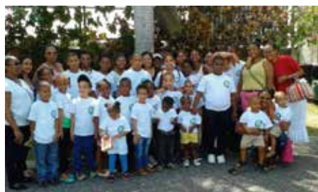
Campamento Verano AMUSSOL 2015