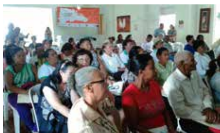
Foro participa Higüey Marzo 2015