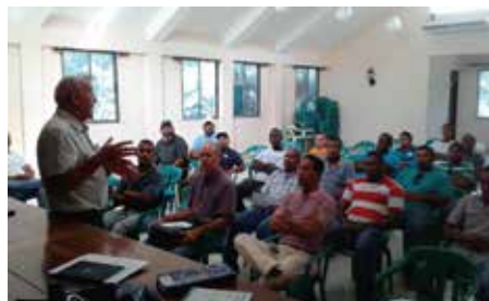
Asamblea SICHOPROVOCA Camioneros de Higüey