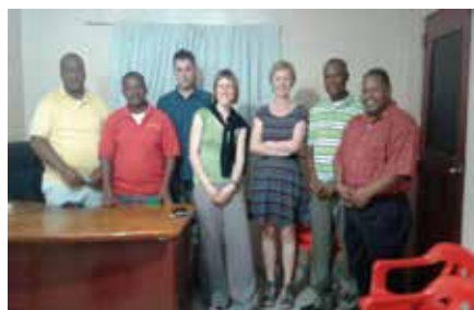
Visita de Campo PASAR en ASOCHOMBOCA BOCA CHICA