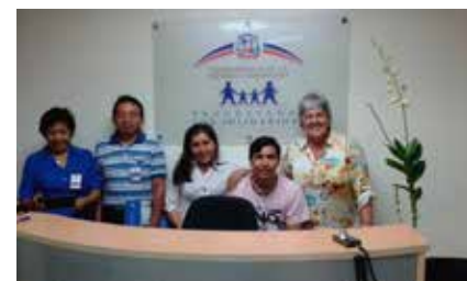
Grupo Pasantes Amussol- CASC en la ofic. del Gabinete de Política Social