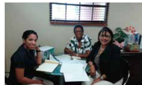
Reunión coordinación AMUSSOL -PROSOLI