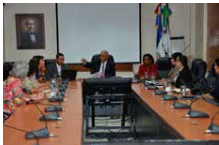
Visita al CNSS pasantes AMUSSOL- CASC