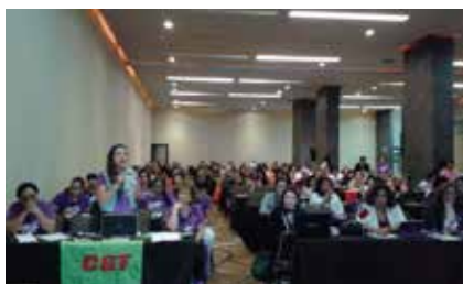
Conferencia de mujeres CSA, Panama 2015